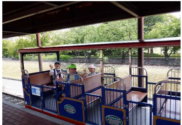
〈5月18日 遠足で明石公園にいきました〉