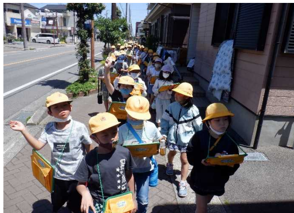
〈5月24日 社会の学習で町探検にいきました〉