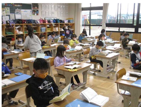
<心落ち着く朝の読書タイム>

学校を引っ張っていく5、6年生が、保健、放送、給食、・・・とどこかの委員会に属して、自分たちの手で学校生活をよくしていく活動をしています。今年度の前半は、思うように活動できませんでしたが、後半、こんな年だからこそ、やることを工夫して活動しています。それらを紹介したいと思います。