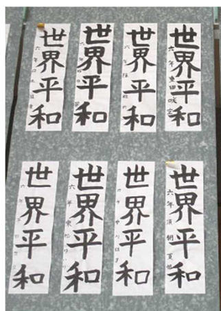
【6年小学校最後の書き初め】

新型コロナウイルス感染拡大のため、とても残念ではありましたが、書き初め展は中止とさせていただきました。お子さんが持ち帰った作品をご家庭で飾り、ご家族みなさんでご覧いただけたらと思います。