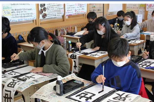
【新年、心新たに臨む】

「事始め」と言って、年の始めに上手になりますように願いを込めてやると早く上達すると言われていいます。1月8日の書き初め会で、子どもたちは、字の形や大きさ、止め、跳ね、払い等に注意し、丁寧書いていました。同時に言葉の意味もよく考えて書いていました。力強い、勢いのある書きっぷりは見事です。どの子も気持ちが入っていたようで、長い時間でしたが、格段に集中して書いていました。きっと字が上達することでしょう。