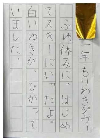
【1年初めての書き初め】